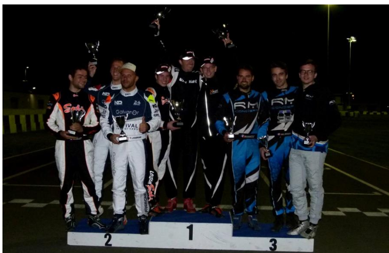
6H du MANS 2017 - Podium GP2